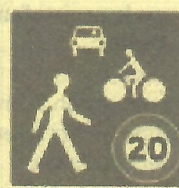
zone de rencontre