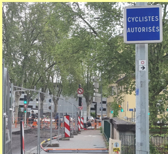
Pont sur la route de l'Hôpital, un panneau désormais ôté

Ce meilleur partage de l'espace public permet à tous, automobilistes, cyclistes et piétons de circuler en site propre et en sécurité.