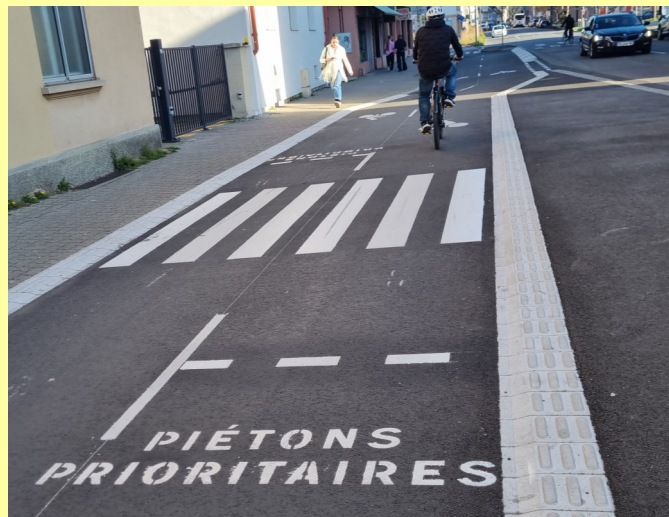
Piste cyclable récente sur la route du Polygone à Neudorf

Piétons 67 note les efforts déployés à Strasbourg pour une meilleure cohabitation piétons et cyclistes et demande aux autres communes de mettre en place également des actions de prévention et de sensibilisation.